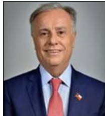
Dr. Emilio Santelices Ex Ministro de Salud