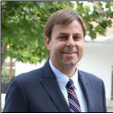
Germán Codina Powers Alcalde de Puente Alto Pdte. AChM