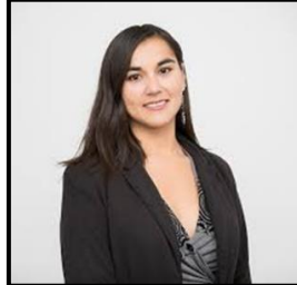
Dra. Izkia Siches Pastén Presidenta Colegio Médico